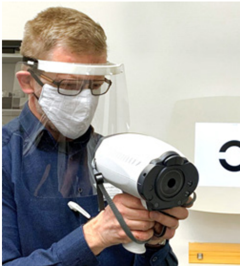
Mitarbeiter mit Gesichtsvisier im BFW Halle